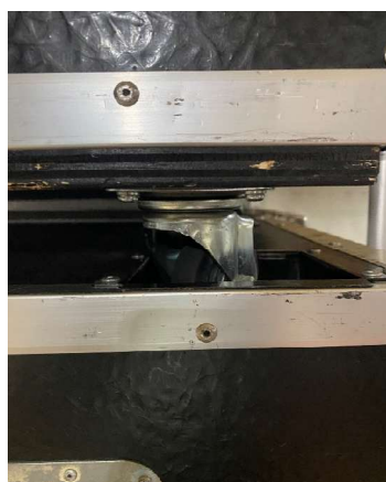
キャスター半落とし2段